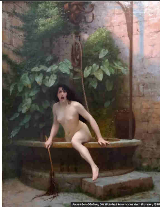
Jean-Léon Gérôme, Die Wahrheit kommt aus dem Brunnen, 1896

Von Wien aus startend formt sich eine neue Friedensbewegung in Österreich. Sei dabei!