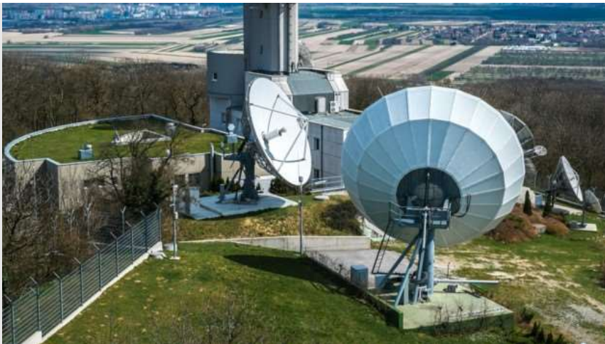
Die Abhörstation Königswarte