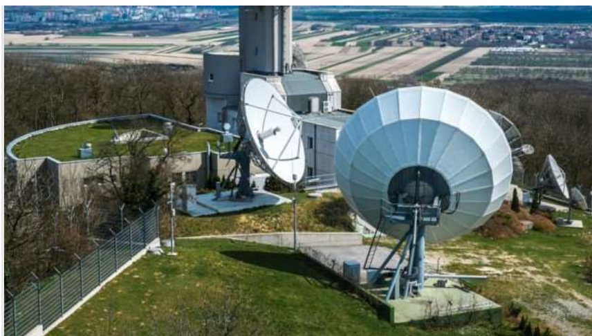
Die Abhörstation Königswarte