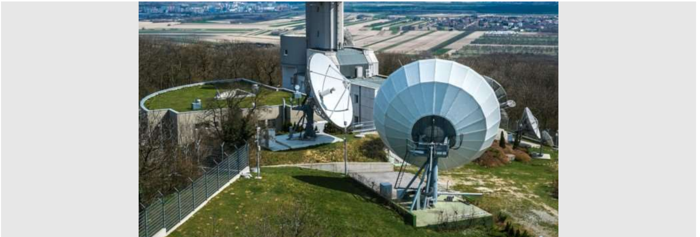
Die Abhörstation Königswarte