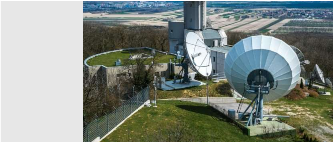
Die Abhörstation Königswarte