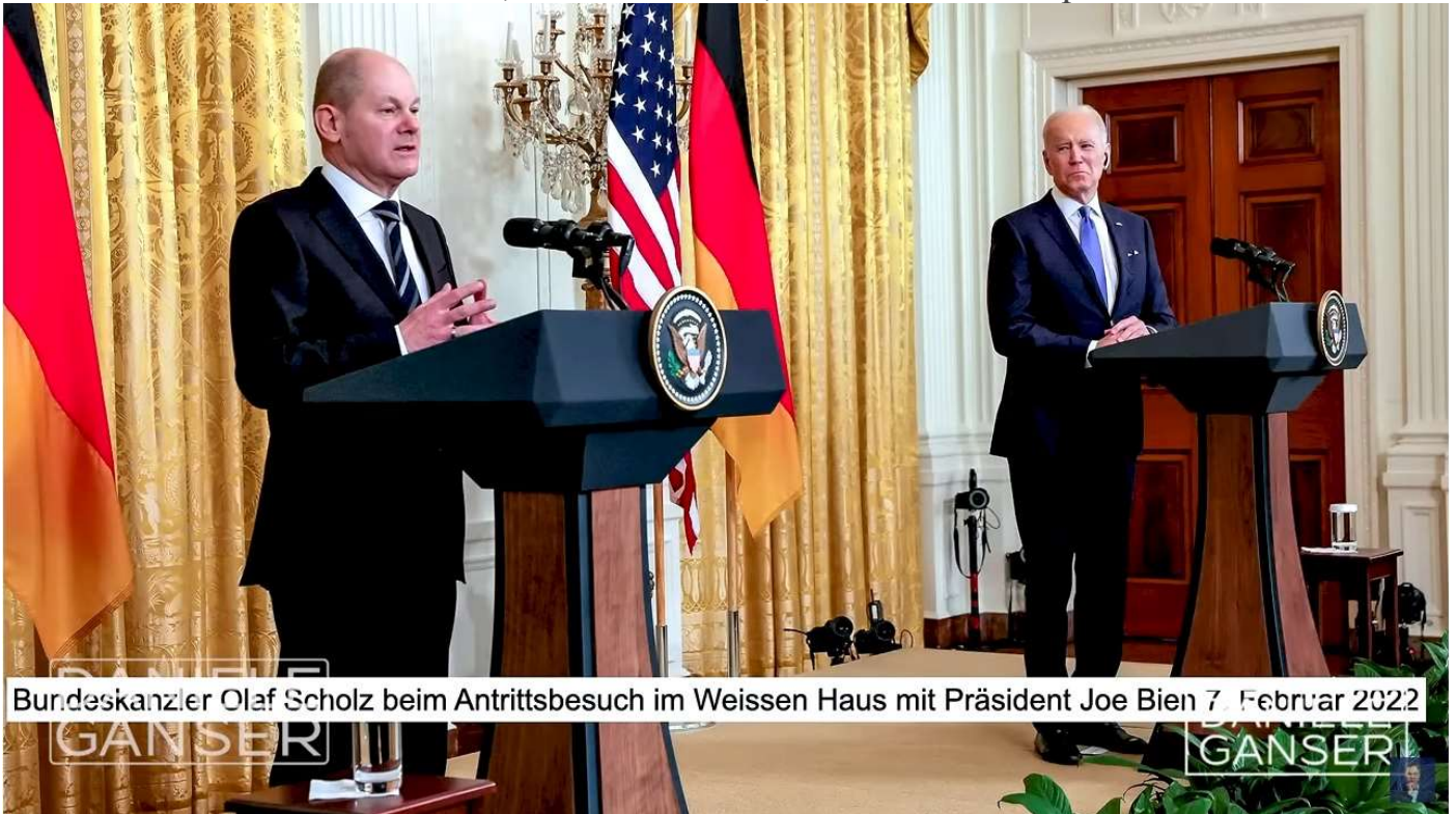
Bundeskanzler Olaf Scholz beim Antrittsbesuch im Weissen Haus mit Präsident Joe Biden 7. Februar 2022