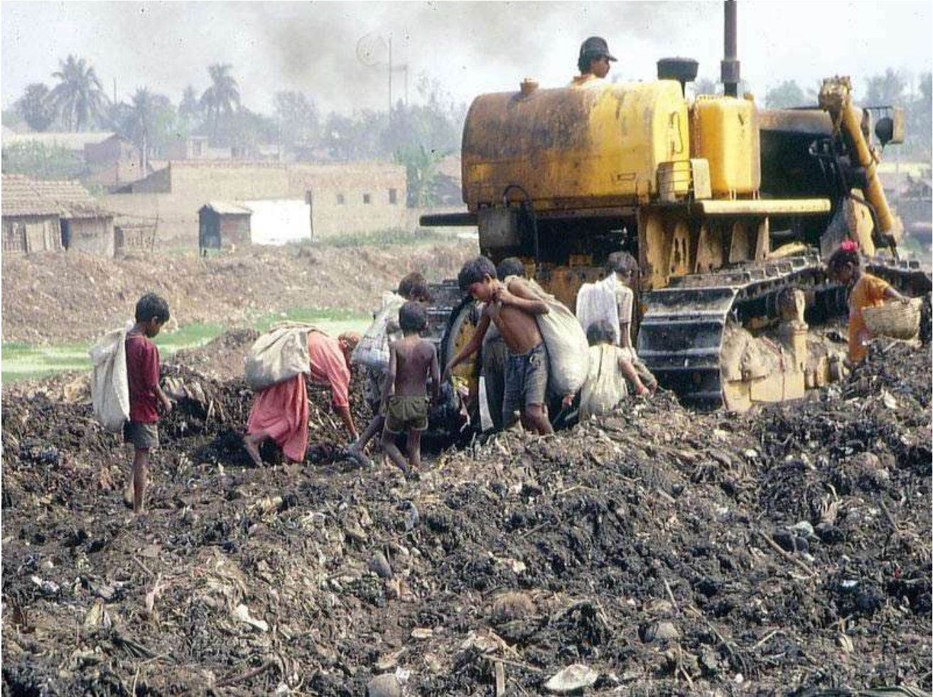
Kinderarbeit auf dem Müllberg