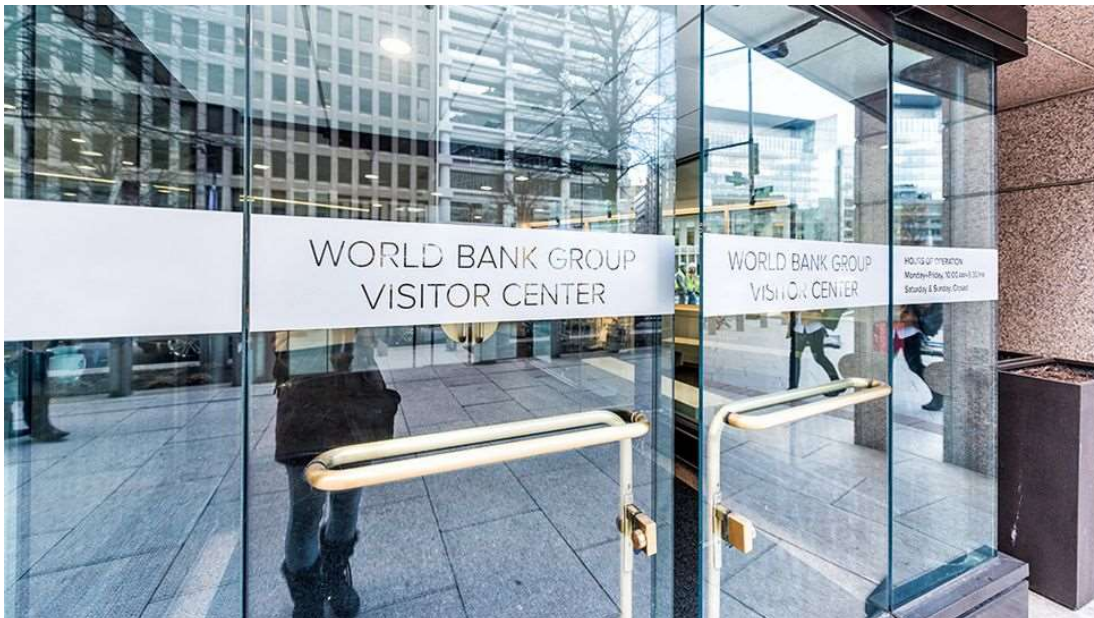
Kristi Blokhin /